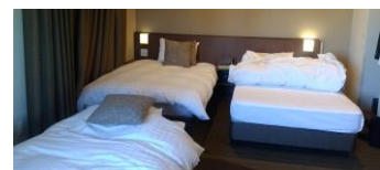
1人なのにベッドが3つ 泣き笑